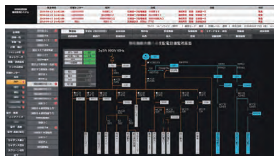
(事例より) 受配電設備監視画面例 ビル、照明、エレベータ、所内電灯、防災・保守などへの受配電設備を系統図で監視しています。