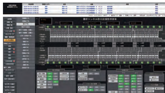
(事例より) トンネルにおける防災設備監視画面例 この1画面のみで、非常電話、スプリンクラー、消火栓など、それぞれ何十もの機器グラフィック・オブジェクトで構成されています。

https://www.sl-j.co.jp/products/resources/download/users_fujitsu.html